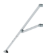
Plate-forme FlexxTower avec trappe