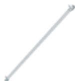
Planche de bordure latérale pour longueur d'échafaudage 1,8 m