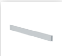
Planche de bordure frontale pour une largeur d'échafaudage de 0,75 m