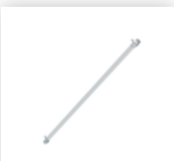
Planche de bordure latérale pour longueur d'échafaudage 1,8 m