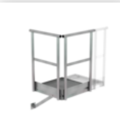
Plate-forme d'extension 500 x 1000 mm