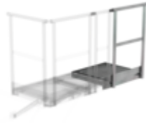
Plate-forme d'extension 400 x 800 mm