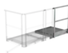
Plate-forme d'extension 800 x 800 mm