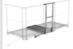
Plate-forme d'extension 1000 x 1000 mm