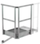
Plate-forme d'extension 500 x 1000 mm