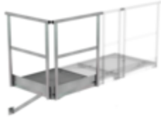
Plate-forme de base 800 x 800 mm