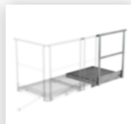
Plate-forme d'extension 800 x 800 mm