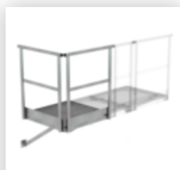
Plate-forme de base 800 x 800 mm