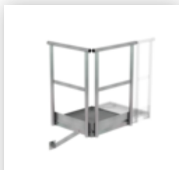
Plate-forme d'extension 500 x 1000 mm