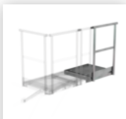
Plate-forme d'extension 400 x 800 mm