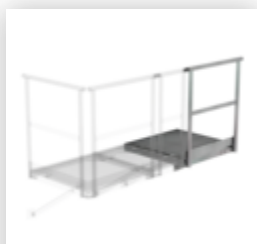
Plate-forme d'extension 800 x 800 mm