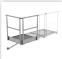
Plate-forme de base 800 x 800 mm