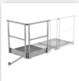
Plate-forme de base 800 x 800 mm