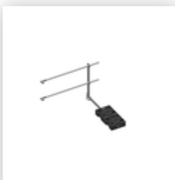
Plate-forme d'extension 1000 x 1000 mm