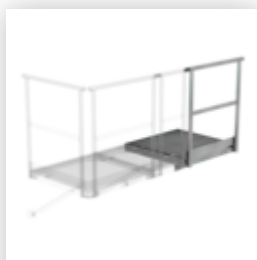
Plate-forme d'extension 500 x 1000 mm