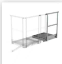
Plate-forme d'extension 400 x 800 mm