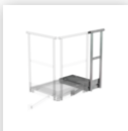
Plate-forme de base 1 000 x 1 000 mm