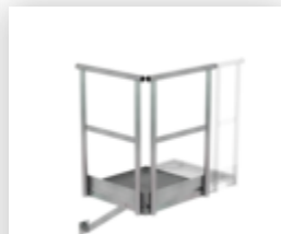
Plate-forme d'extension 500 x 1000 mm