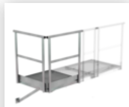
Plate-forme de base 800 x 800 mm