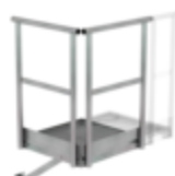
Plate-forme d'extension 500 x 1000 mm