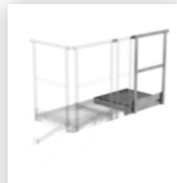
Plate-forme d'extension 400 x 800 mm