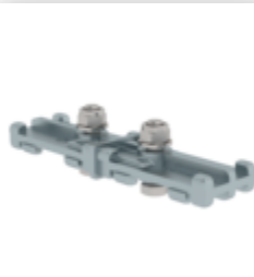
Plate-forme de changement entre sections d'échelle Ø 700 mm Acier galvanisé