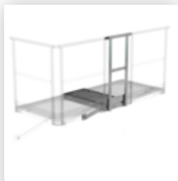
Plate-forme d'extension 1000 x 1000 mm