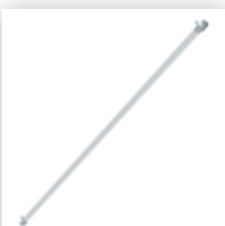
Planche de bordure latérale pour longueur d'échafaudage 3,0 m