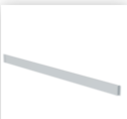
Planche de bordure frontale pour une largeur d'échafaudage de 1,35 m