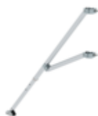
Planche de bordure frontale FlexxTower