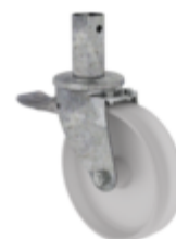
N° de commande: 027958 Roulette orientable Ø 200 mm avec frein d'arrêt et pivots