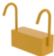
N° de commande: 027912 Lest avec arceaux de suspension RAL 1021