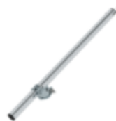
N° de commande: 027920 Support d'espacement mural réglable Réglable jusqu'à 1,0 m