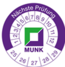
N° de commande: 019175 Autocollant produit, plaquette de contrôle 40 x 40 mm