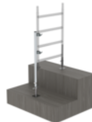
N° de commande: 070506 Rallonge de cadre, fixation par serrage Plage de réglage de 400 mm max.