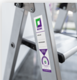
N° de commande: 019176 Autocollant d'inventaire