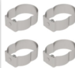
N° de commande: 019136 Anneau élastique pour échafaudage roulant avec goujon court, fermé