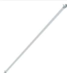
Planche de bordure latérale pour longueur d'échafaudage 3,0 m