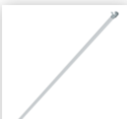
Planche de bordure latérale pour longueur d'échafaudage 3,0 m