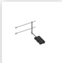
Plate-forme d'extension 1000 x 1000 mm