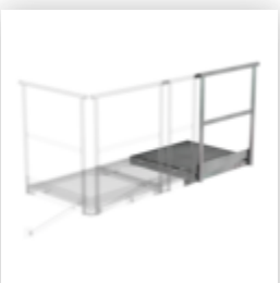
Plate-forme d'extension 800 x 800 mm