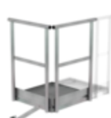
Plate-forme d'extension 500 x 1000 mm