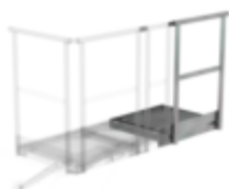
Plate-forme d'extension 400 x 800 mm