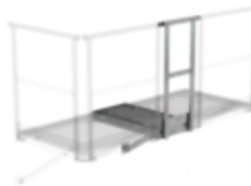
Plate-forme d'extension 1000 x 1000 mm