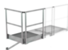
Plate-forme de base 800 x 800 mm