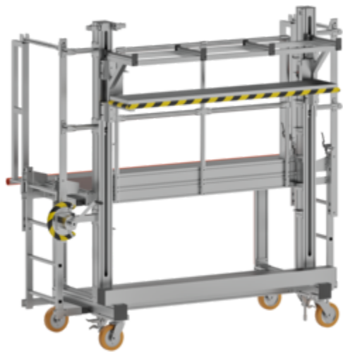
Plate-forme de travail mobile