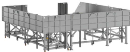
Plate-forme de travail avec garde-corps à réglage électrique, partiellement mobile