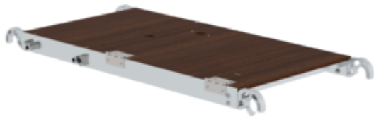
Plate-forme FlexxTower avec trappe